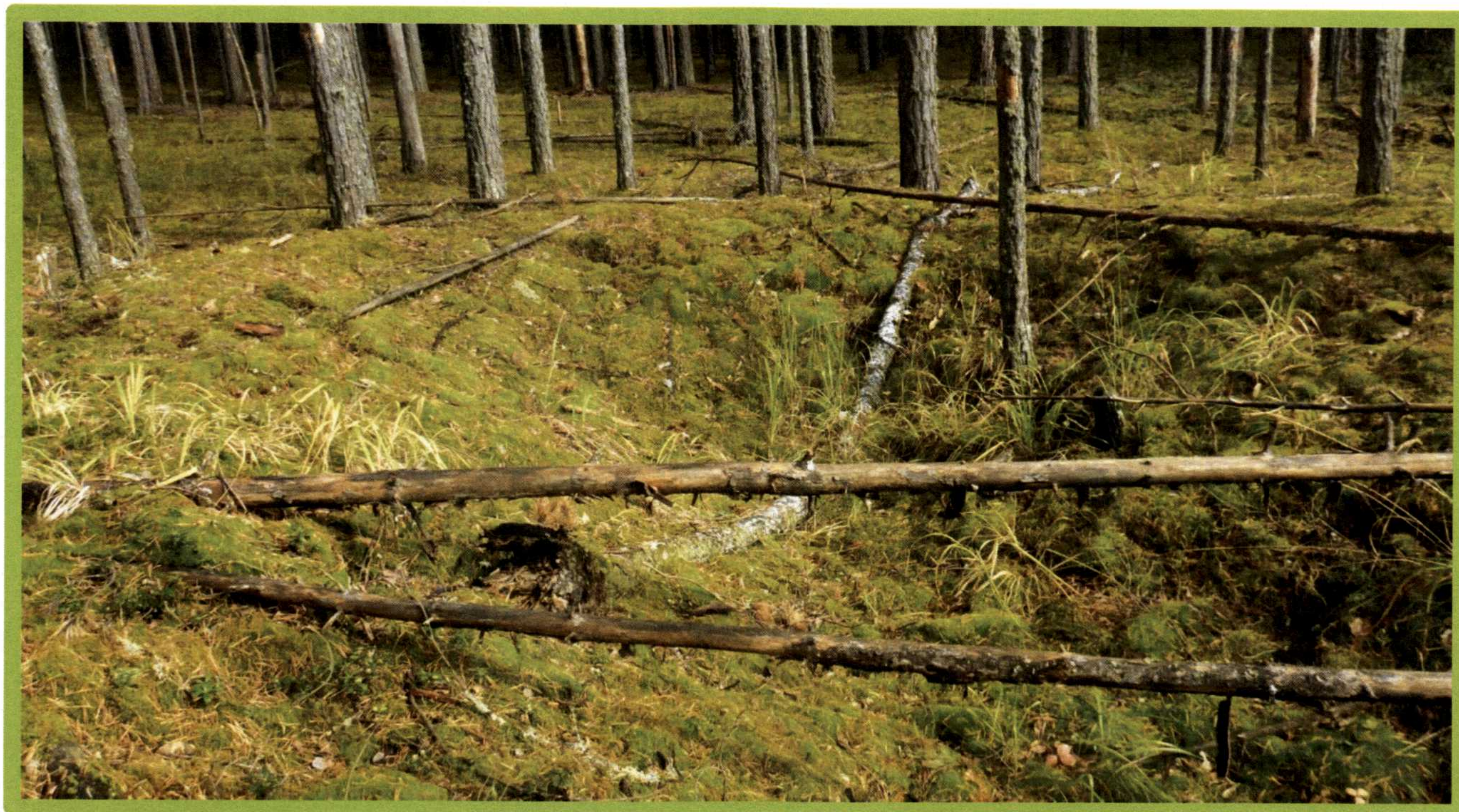
Изображение № 1 Валежник

Примеры валежника (смотри изображения №№ 1,2,3).